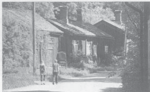
Pienet asuintalot Lippukallion kupeessa kuuluvat ruukin vanhimpiin rakennuksiin.